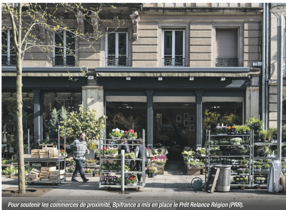
Pour soutenir les commerces de proximité, Bpifrance a mis en place le Prêt Relance Région (PRR).

En 10 ans, Bpifrance est devenue un acteur majeur de l'innovation et de la transformation économique du territoire national et l'un des plus grands investisseurs européens. Comme le confirment les chiffres, le bilan est positif : 535 000 TPE, PME, ETI et grandes entreprises soutenues, 70 000 entreprises financées chaque année en moyenne et 20 000 accompagnées pour des projets de développement à l'international. Depuis 2012, Bpifrance propose 80 % de nouvelles offres de soutien. Au total, 50 Md€ ont été injectés dans l'industrie en 10 ans et 23 Md€ ont été consacrés à la transformation écologique et environnementale. Enfin, 500 fonds de capital-investissement privés ont été souscrits avec une gestion assurée par 200 sociétés de gestion partenaires.