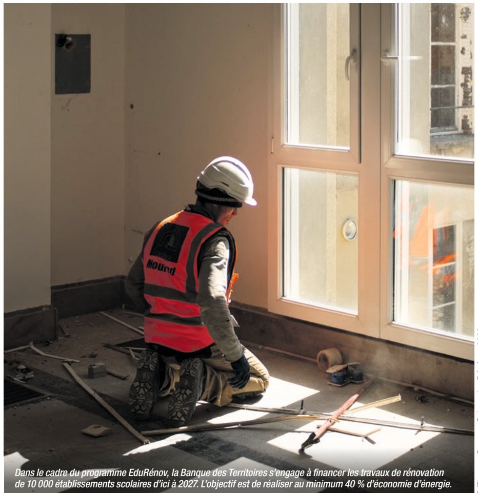
Dans le cadre du programme EduRénov, la Banque des Territoires s'engage à financer les travaux de rénovation de 10 000 établissements scolaires d'ici à 2027. L'objectif est de réaliser au minimum 40 % d'économie d'énergie.

La réhabilitation-extension de l'école maternelle Jacqueline Quatremaire permettra de générer 40 % d'économie d'énergie tout en augmentant sa capacité d'accueil (300 élèves supplémentaires). La Banque des Territoires a attribué un prêt de 4 M€ sur un montant global de travaux de 10 M€.