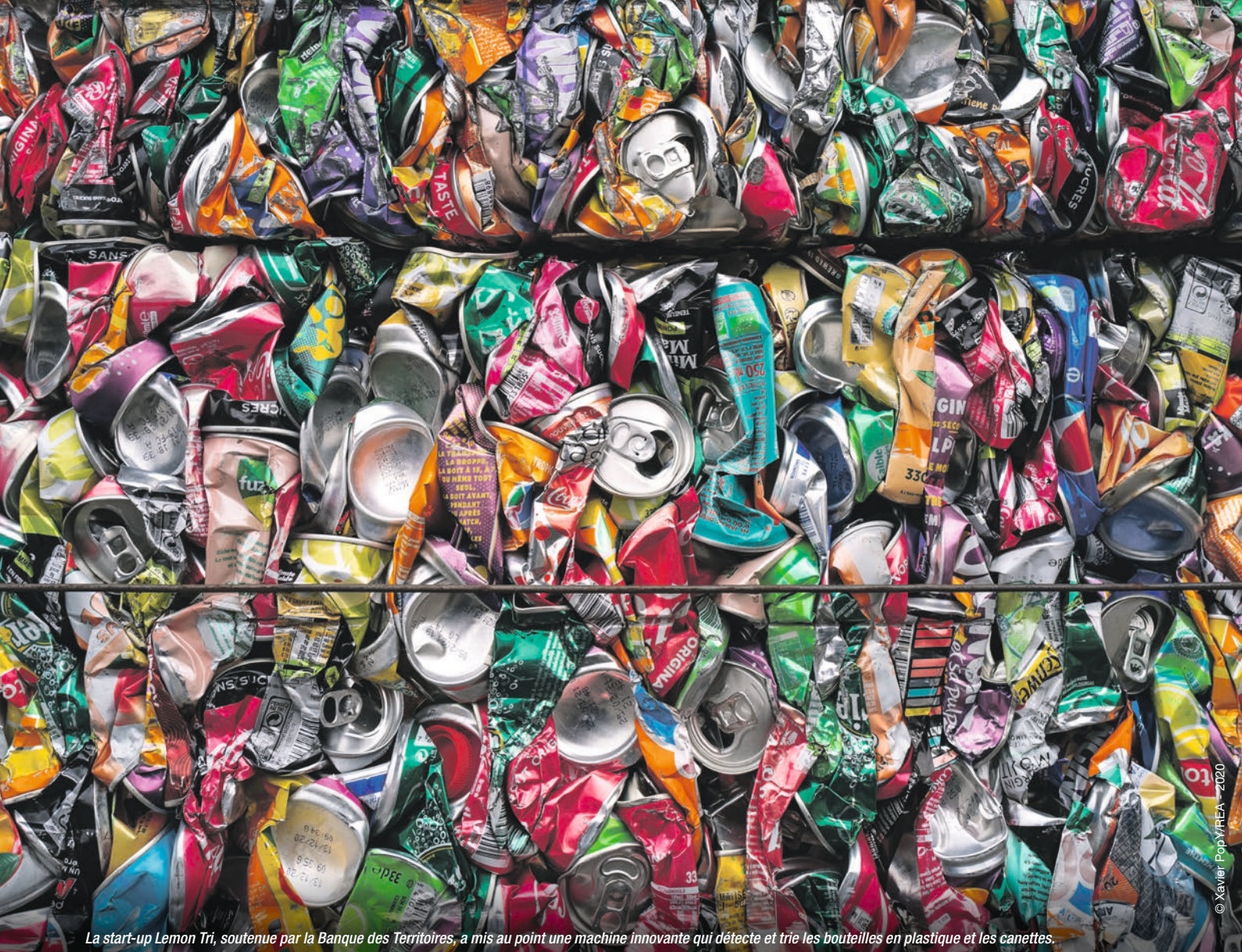
La start-up Lemon Tri, soutenue par la Banque des Territoires, a mis au point une machine innovante qui détecte et trie les bouteilles en plastique et les canettes.