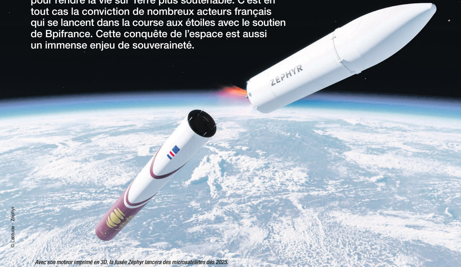
Avec son moteur imprimé en 3D, la fusée Zéphyr lancera des microsattellites dès 2025.

Souvent décriée pour son empreinte carbone, l'industrie spatiale peut aussi apporter des solutions pour rendre la vie sur Terre plus soutenable. C'est en tout cas la conviction de nombreux acteurs français qui se lancent dans la course aux étoiles avec le soutien de Bpifrance. Cette conquête de l'espace est aussi un immense enjeu de souveraineté.