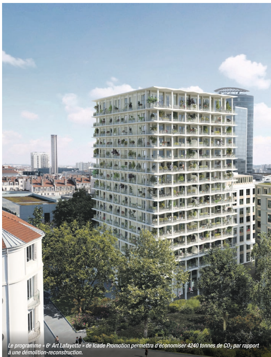
Le programme « 6 e Art Lafayette » de Icade Promotion permettra d'économiser 4240 tonnes de CO 2 par rapport à une démolition-reconstruction.

Dans le cadre de ce programme immobilier labellisé BBC Effinergie Rénovation, certifié NF HQE Habitat Rénovation, 4 240 tonnes de CO 2 seront économisées par rapport à une démolition-reconstruction (moins 34 % d'impact carbone). Un projet conforme aux engagements environnementaux et aux objectifs de Icade Promotion : réduire l'empreinte carbone de son activité de 41 % entre 2019 et 2030.