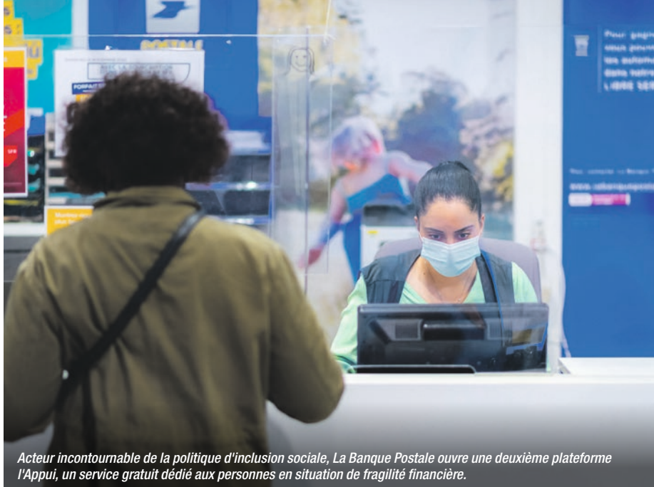
Acteur incontournable de la politique d'inclusion sociale, La Banque Postale ouvre une deuxième plateforme l'Appui, un service gratuit dédié aux personnes en situation de fragilité financière.

Élaboré et géré par la Caisse des Dépôts pour le compte du ministère du Travail, du Plein-emploi et de l'Insertion, le passeport de compétences en ligne est propre à chaque titulaire d'un compte personnel de formation (CPF). Il présente la compilation, dans un seul espace, de toutes les compétences acquises au long du parcours professionnel. La transmission directe des données (formations, diplômes, certifications) à la Caisse des Dépôts par les organismes garantit leur authenticité. Actuellement accessible dans sa version bêta, il offrira par la suite de nombreuses fonctionnalités. Parmi elles, la possibilité de déclarer soi-même des informations complémentaires et de faire le point sur ses acquis professionnels pour définir ses besoins de formation.