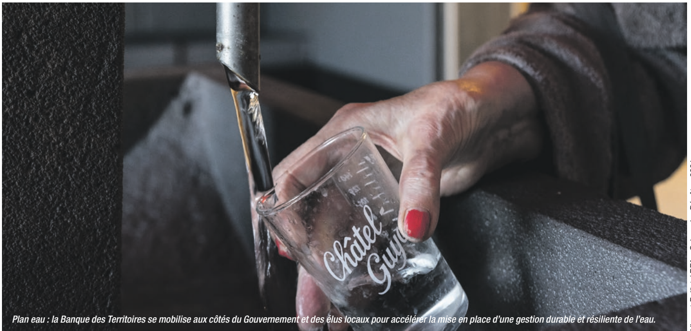
Plan eau : la Banque des Territoires se mobilise aux côtés du Gouvernement et des élus locaux pour accélérer la mise en place d'une gestion durable et résiliente de l'eau.