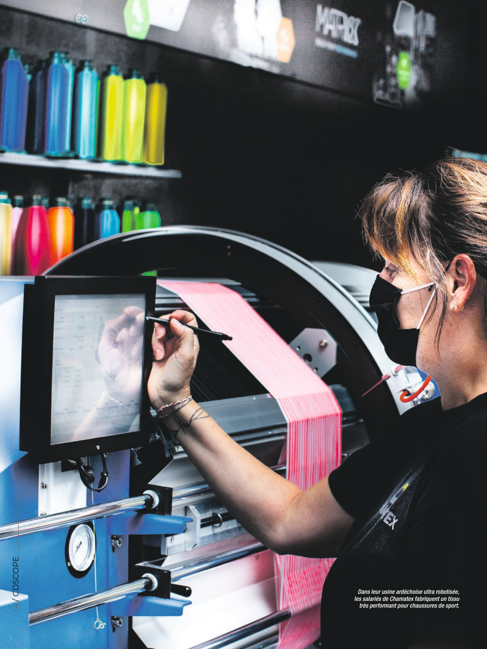
Dans leur usine ardéchoise ultra robotisée, les salariés de Chamatex fabriquent un tissu très performant pour chaussures de sport.