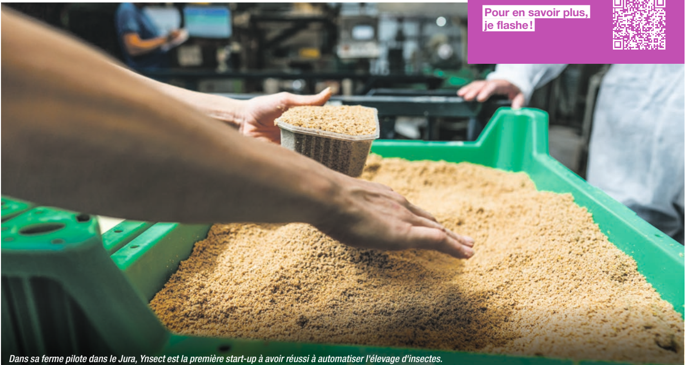
Dans sa ferme pilote dans le Jura, Insect est la première start-up à avoir réussi à automatiser l'élevage d'insectes.